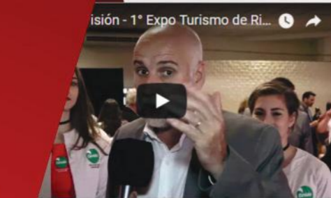
EXPO TURISMO DE RÍO CUARTO

Periodico La Ribera La Ribera Television