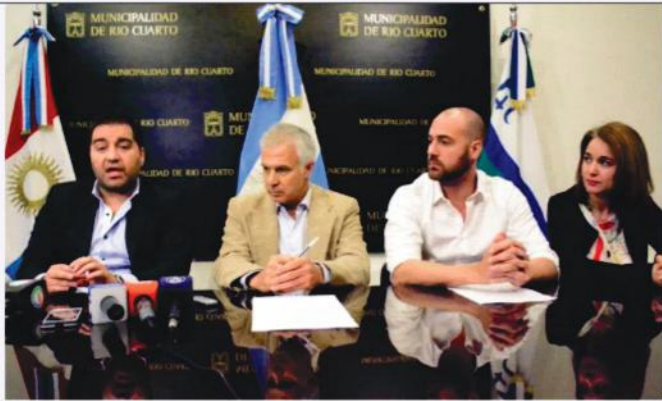
EL GOBIERNO DE RIO CUARTO ADQUIRIRÁ 5 NUEVOS ZOOTROPOS