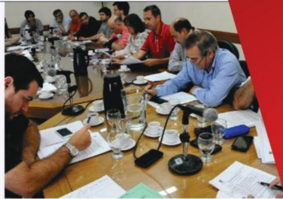
LA UNIVERSIDAD AUMENTÓ LOS MONTOS DE BECAS PARA ESTUDIANTES